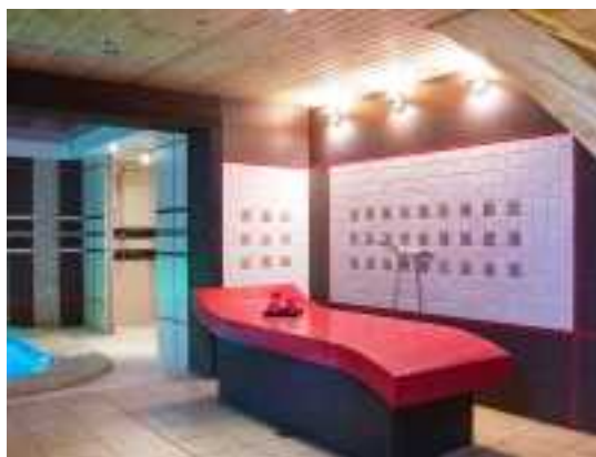
Снять коттедж в Минске