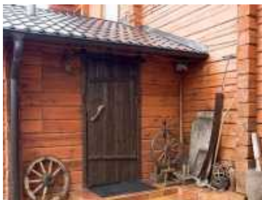
Снять коттедж в Минске