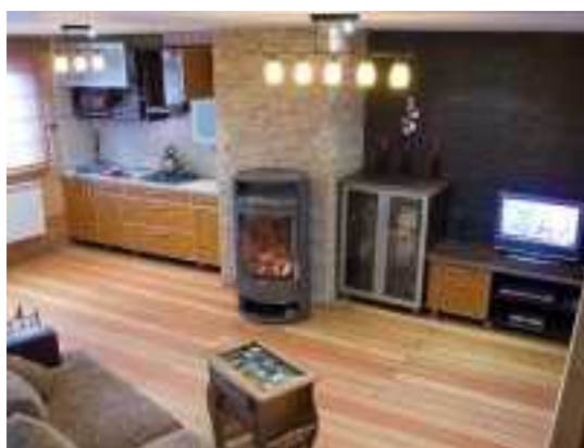
Снять коттедж в Минске