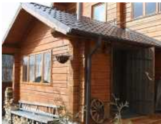
Снять коттедж в Минске