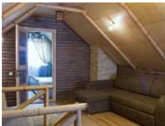
Снять коттедж в Минске