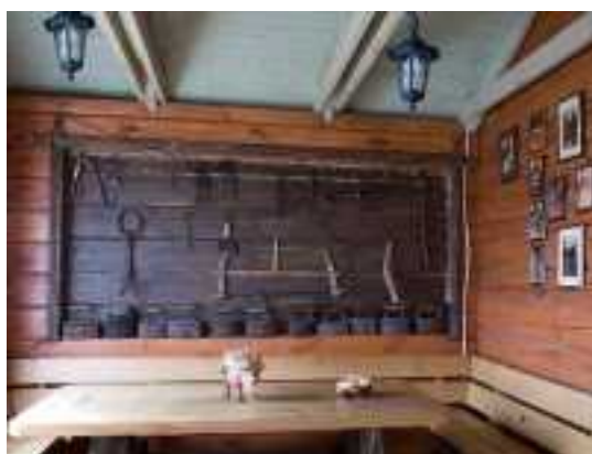
Снять коттедж в Минске