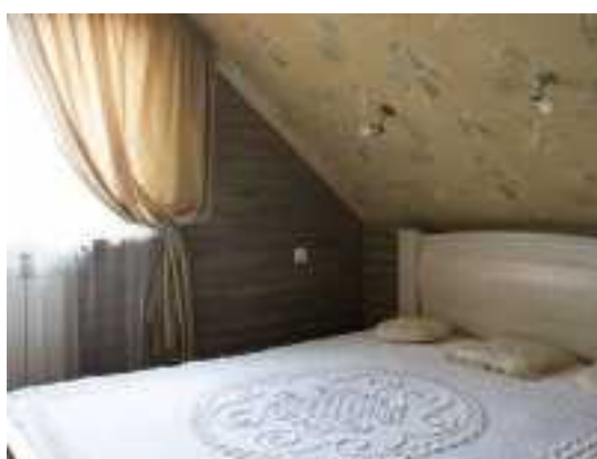
Снять коттедж в Минске