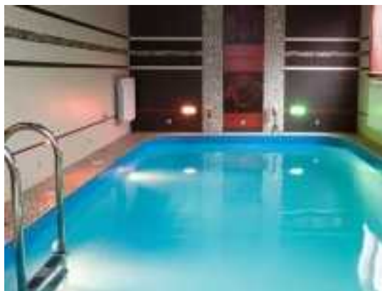
Снять коттедж в Минске