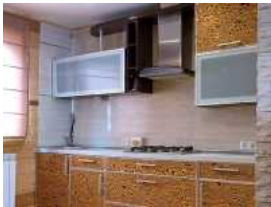
Снять коттедж в Минске

НОВИНКА!!!! Вы хотите незабываемо отдохнуть, а усадьба уже занята? Не расстраивайтесь! В Беларусь появилось еще одно место, которое поразит неповторимым дизайном, уютom и гостеприимством. Добро пожаловать в другую усадьбу, которая находится всего в 80 км от Минска, возможен трансфер и расположена прямо на берегу Немана.